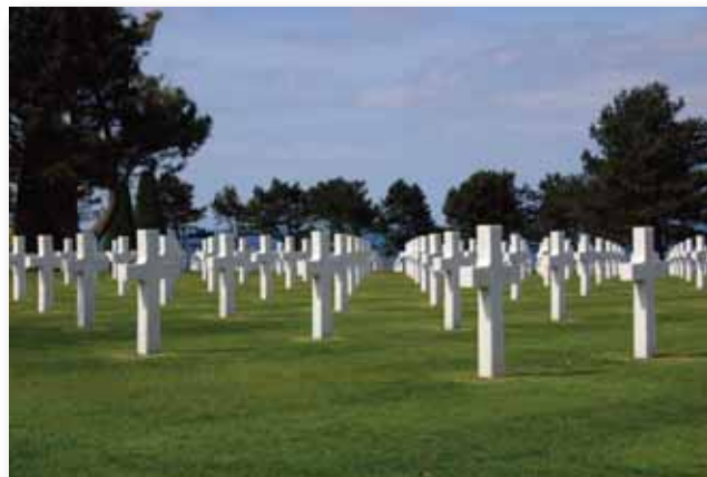
„WSZYSCY, KTÓRZY SĄ W GROBACH, USŁYSZĄ GŁOS JEGO I WYJDĄ” JANA 5: 28, 29

Cały Boski plan jest objawieniem Jego charakteru. Dostrzegamy pokaz Boskiej sprawiedliwości w postępowaniu z rodzajem ludzkim. Kiedy