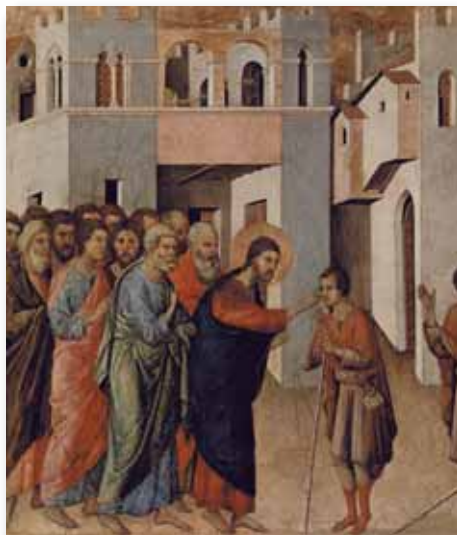
JEZUS UZDRAWIAJĄCY GŁUCHONIEMEGO MAR. 7:31-37

wali się, iż rozumieją głębokie sprawy Boże, zanim nie staną się w pełni braćmi w Panu. Nie ma innej drogi; to nie znaczy, że stając się w pełni braćmi, dostaniecie się pod jarzmo niewoli, ponieważ my nie mamy jarzma niewoli; Syn uczynił nas wolnymi i wszyscy z nas chcą pozostać wolni. To jest duch, którego mamy, to jest duch, którym zostaliśmy spłodzeni, to jest duch Prawdy, o którym nasz drogi Odkupiciel powiedział, „Poznaście prawdę, a prawda was wyzwolodzi”. Zatem im więcej otrzymujecie Prawdy, tym bardziej w rzeczywistości stajecie się wolni.