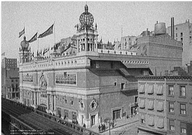
HIPPODROM, NOWY YORK, 1910 R.

On daje do zrozumienia, że będą dwa rodzaje potomstwa Abrahama – on będzie miał niebiańskie oraz ziemskie potomstwo. Pamiętamy, jak Bóg w Piśmie Świętym powiedział: „Twoje potomstwo będzie jak gwiazdy na niebie, a także jak piasek na brzegu morza”. Ostatecznie, te dwa rodzaje potomstwa będą błogosławić świat. Gdy tylko niebiańskie potomstwo zostanie skompletowane – a wierzymy, że jest to bardzo bliskie – wówczas Boskie błogosławieństwo zacznie spływać na jego ziemskie potomstwo. I co zauważamy, drodzy przyjaciele? Czy dostrzegacie położenie, w którym znajdujemy się, jako ludzkość? Czy widzicie choroby i słabość świata ludzkości obecnie? Czy zdajecie sobie sprawę, że prawdziwą przyczyną tego wszystkiego jest grzech i czy wiecie, że Bóg oświadczył, jak wam czytałem, iż nadchodzi czas, gdy On usunie wszystko to, co jest skutkiem grzechu. Wy i ja oraz cała ludzkość cierpi z powodu tych rzeczy i one wszystkie przeminą. Czyż nie oznacza to, że w słusznym czasie pustynia zakwitnie jak róża, a step rozweseli się z tego powodu, że