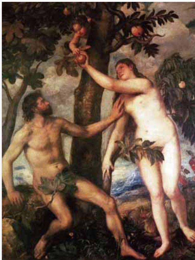
“ALBOWIEM DNIA, KTÓREGO JEŚĆ BĘDZIESZ Z NIEGO, ŚMIERCIĄ UMRZESZ” 1 MOJŻ. 2:17

Jego uczniami, tak wszyscy będziemy musieli przejść pewne próby. Jakie to są próby? One mają dowieść naszej lojalności wobec Niego; posłuszeństwa. Jak był próbowany Adam? Nie przez owoc, nie przez to ile zjadł owoców, lecz to jego posłuszeństwo, jego lojalność była próbowana. Pan Bóg nakazał człowiekowi, mówiąc: „Ale z drzewa wiadomości dobrego i złego, jeść z niego nie będziesz; albowiem dnia, którego jeść będziesz z niego, śmiercią umrzesz” (1 Moj. 2: 17).