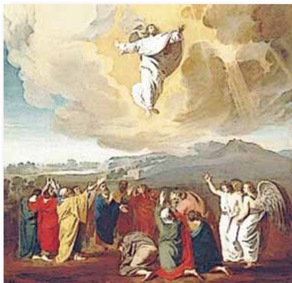
PO WNIEBOWSTĄPIENIU JEZUSA ROZPOCZĘŁA SIĘ OFIARA KOŚCIOŁA

Typiczne Ofiary za grzech w izraelskim Dniu Pojednania ukazują nam tę samą ofiarę Jezusa, która stanowi cenę okupu, lecz jest to różny obraz, ponieważ on ukazuje, jak Bóg używa zasługi Chrystusa do usunięcia ludzkich grzechów. Ten ostat-