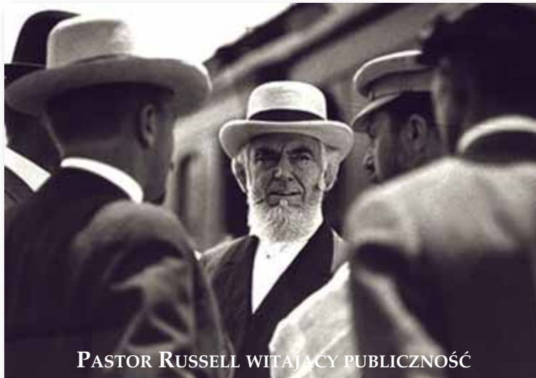
PASTOR RUSSELL WITAJĄCY PUBLICZNOŚĆ

Niebiański Ojciec stworzył ludzkość, uczynił też miejsce wiecznych mąk i zamierzył, iż znaczna część ludzkich istot, które stworzył, będzie poddana wiecznym torturom. Pogląd ten, jak wierzymy, przynosi Bogu wielką hańbę. To z powodu tej teorii, błędnie opisującej Boga, Jego charakter oraz Jego zamiary względem ludzi, świat jest świadkiem